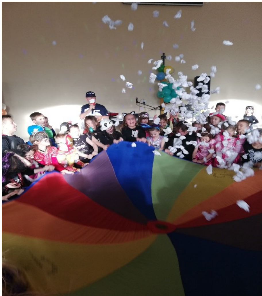
Zabawa była przednia