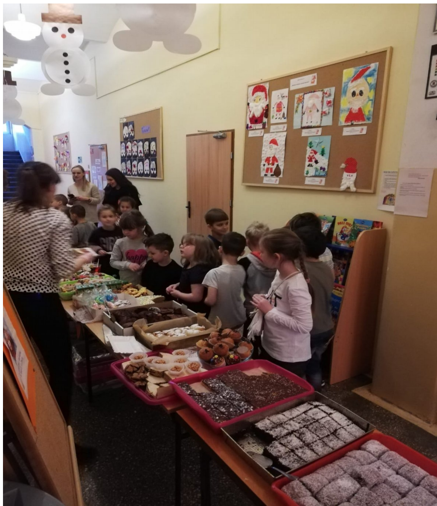
Uczniowie całymi klasami wspierali naszą akcję.

Każdy powinien pomagać , jeśli tylko może.